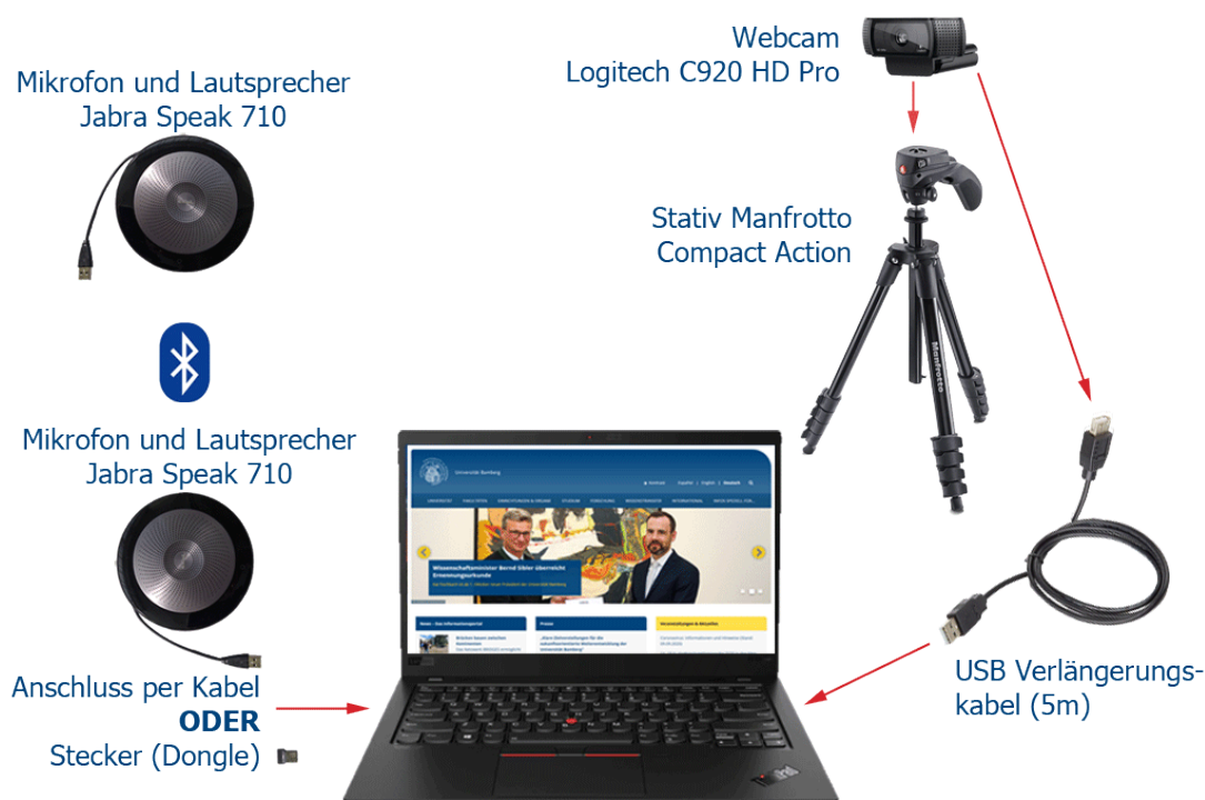
Abbildung 1 – Komponenten des Video-Pakets, ihr Aufbau und Anschluss

In der nachfolgenden Abbildung sehen Sie, dass das Paket eine Webcam (Logitech C920 HD Pro), zwei Mikrofone (Jabra Speak, die auch als Lautsprecher fungieren können), ein Stativ und ein USB-Verlängerungskabel enthält. Mikrofon und Kamera werden per USB an den Computer angeschlossen. Die beiden Jabra Speak-Geräte werden per Bluetooth miteinander verbunden.